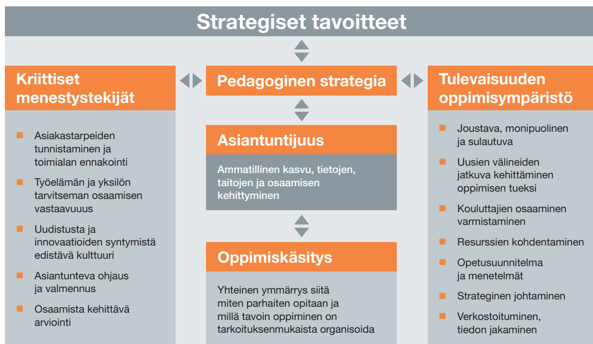
Kuvio 1. Pedagogiseen strategiaan vaikuttavat tekijät